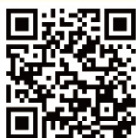
Aplicação móvel da DSEDJ