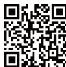
Página do Facebook @dsedjmacau